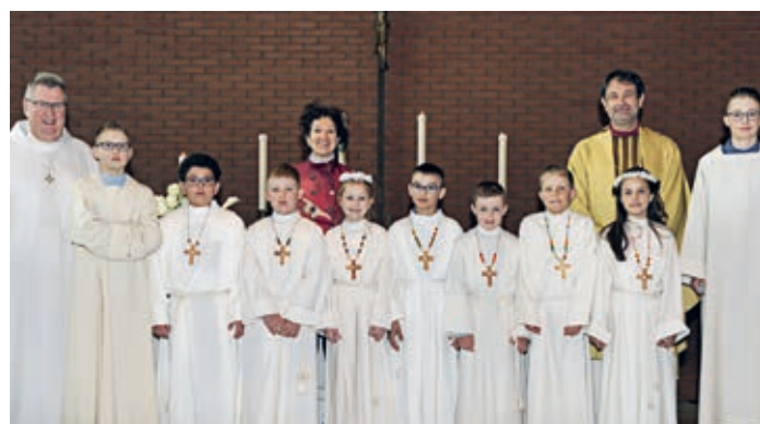
Impressionen der Feierlichkeiten.