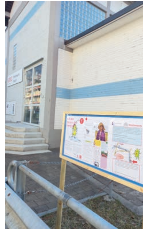
Der erste Posten beim eps-Wasserkraftwerk