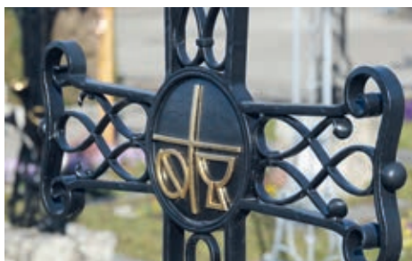
Grabkreuz Friedhof Schwyz