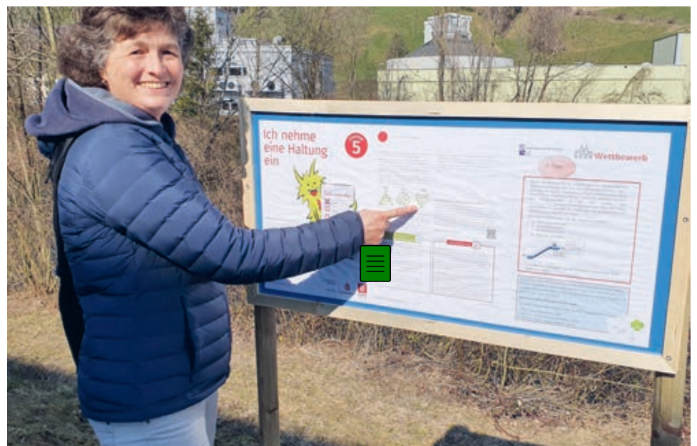
Uns erwartet ein spannender Lehrpfad für Gross und Klein