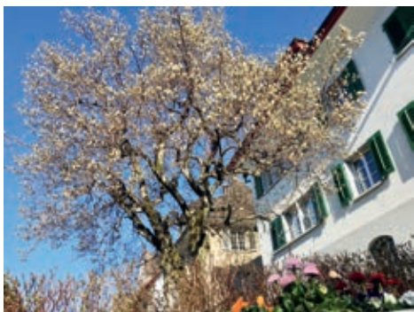
Der Magnolienbaum erwacht ...

Der Themenweg ist ab Ostern im Pfarrhausgarten an der Herrengasse 22 öffentlich zugänglich.