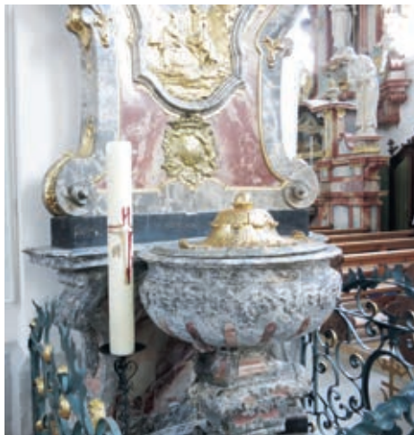
Taufstein der Pfarrkirche Schwyz

Die Tauftermine selbst sind meistens entweder am späteren Samstagvormittag oder am Sonntagvormittag nach dem Pfarreigottesdienst.