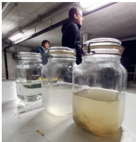
Verschiedene Stufen von gereinigtem Wasser.

Das Wasser ist eine wertvolle Ressource. Tragen wir Sorge dazu!