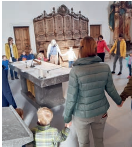
Um den Altar und im Chor gibt es viel zu sehen.

Die Chlichinderfiir vom 12. März fand in Form einer Kirchenführung statt.