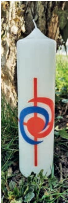
Osterkerze Sujet 2022

Traditionell verkauft eine Gruppe von Blauringmitgliedern gesegnete Heimosterkerzen nach der Osternachtfeier und dem Gottesdienst an Ostersonntag.