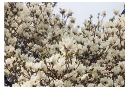
... und steht wenige Tage später in voller Pracht.