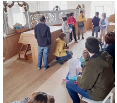
Auf der Empore bei der Orgel.