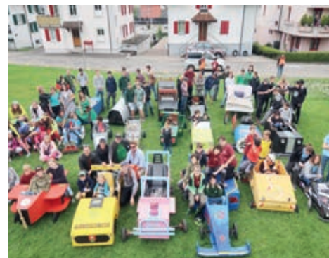
Rennfahrerinnen und Rennfahrer mit ihren bunten Seifenkisten beim Derby nr 5 im 2019