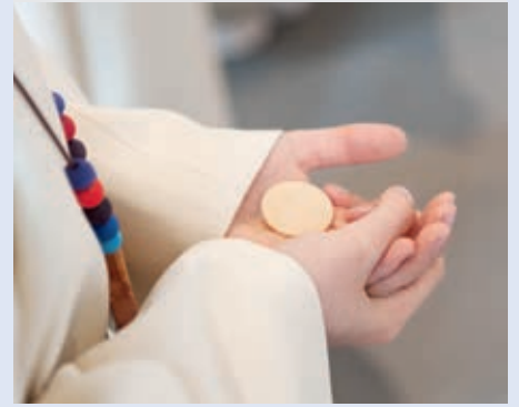
Der grosse Augenblick ist gekommen