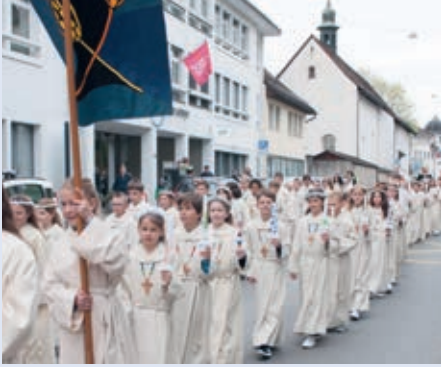
Feierlicher Einzug durch die Herrengasse