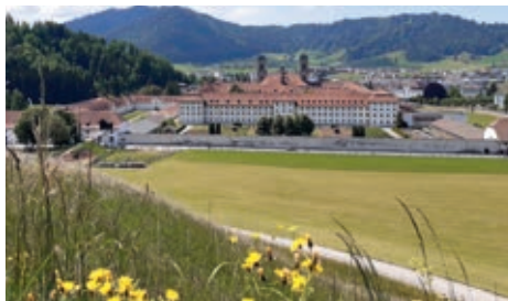
Blick auf das Kloster Einsiedeln

06.00 Besammlung Pfarrkirche Rothenthurm für die Fusswallfahrt 09.20 feierlicher Einzug 09.30 Eucharistiefeier in der Klosterkirche Einsiedeln, mit Kirchenchor Muotathal 10.30 Auszug 10.45 Apéro für alle beim Alten Schulhaus 14.30 Segensandacht bei der Gnadenkapelle