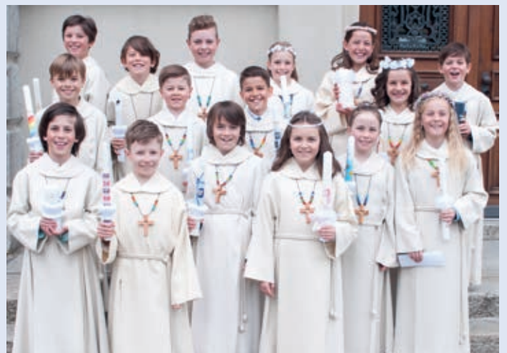
Erstkommunionkinder Schulhaus Herrengasse