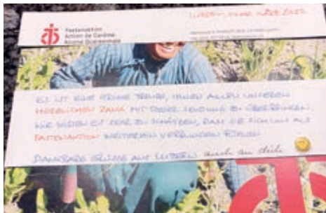
Die Fastenaktion bedankt sich bei unseren Pfarreien für unsere diesjährigen Spendeaktionen

Herzlichen Dank den Jugendlichen, Schülerinnen und Schülern, den Katechetinnen und Katecheten, der Missionsgruppe Ibach, den Seelsorgenden und Sekretärinnen der drei Pfarreien, den Bäckereien fürs Fastenbrot und euch allen, die sich an vielen Aktionen und Anlässen über das Projekt von «Grupo Semillas» in Kolumbien informiert und teilgenommen, Geld gesammelt und gespendet haben. Gemeinsam schaffen wir vieles!