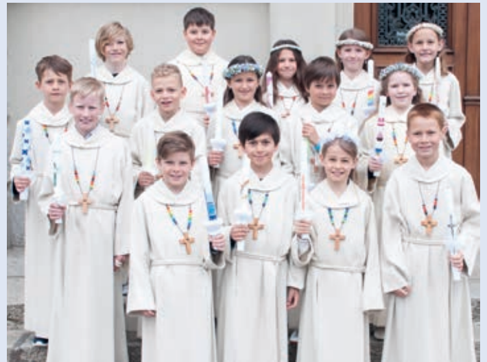
Erstkommunionkinder Schulhaus Rickenbach