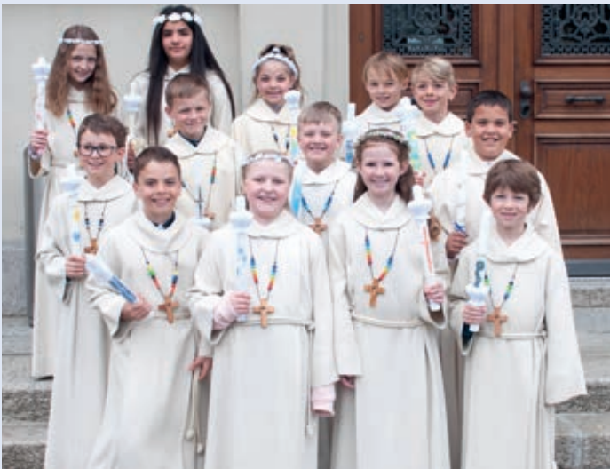
Erstkommunionkinder Schulhaus Lücken