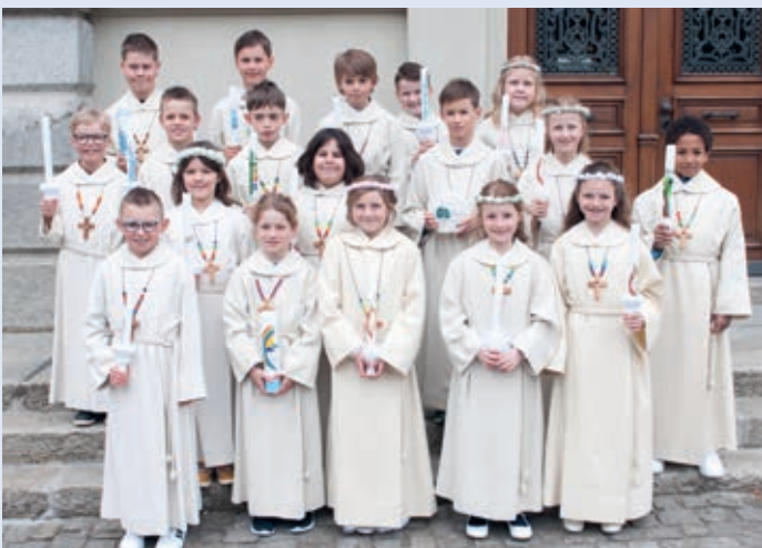
Erstkommunionkinder Schulhaus Herrengasse