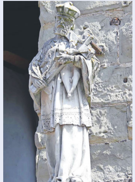
Brückenheiliger Johannes Nepomuk

Die fünf Sterne, die das Haupt des Johannes zieren, kommen einerseits von der Legende her, dass die Sterne bei der Auffindung des Leichnams in der Moldau besonders geleuchtet hätten. Die Zahl Fünf wird später auf die fünf Buchstaben hingedeutet: TACUI, was aus dem