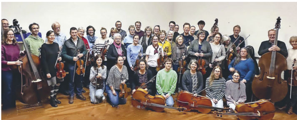
Das Orchester Schwyz-Brunnen freut sich, drei Komponistinnen eine musikalische Plattform zu bieten