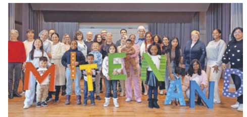
Das Team von «Mitenand Brunnen» mit den Lernenden und ihren Familien wirkte anlässlich ihres 10-jährigen Jubiläums im ökum. Gottesdienst mit.

Zur feinen Fastensuppe servierten Männer und Frauen des Mitenand leckere Häppchen aus ihren Heimatländern und der Frauenverein sorgte durch seine charmante Bewirtung und mit einem grossen Kuchenbuffet für rundum zufriedene Gesichter.