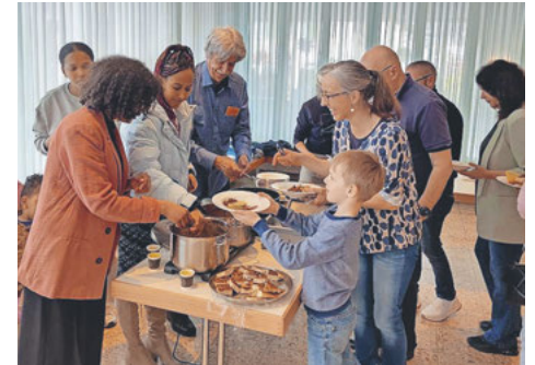
Neben der feinen Fastensuppe wurden «Häppchen» aus der Heimat der Geflüchteten angeboten.

Im Familiengottesdienst wurden Geflüchtete mit entwurzelten Bäumen verglichen und ihre Erlebnisse mit einer Pflanzen-Umtopf-Aktion veranschaulicht. Ganz nach dem Motto der diesjährigen Fastenkampagne «Zukunft säen» sind wir alle aufgefordert, fremden Menschen mit Offenheit und Akzeptanz zu begegnen, damit sie bei uns neue Wurzeln schlagen und optimistisch in die Zukunft blicken können.