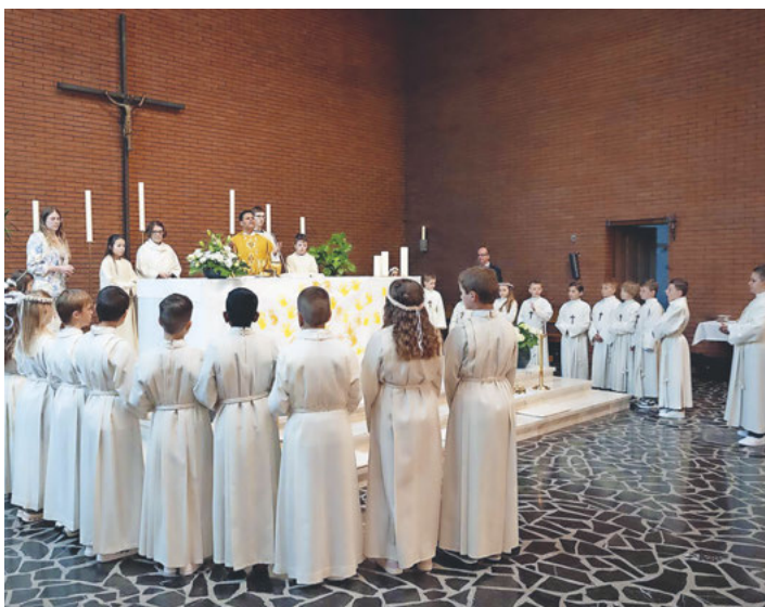
Erstkommunionkinder in Seewen