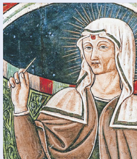
Hl. Rita von Cascia

Durch ihre mystische Verbindung mit Christus bekam sie das Stigma einer