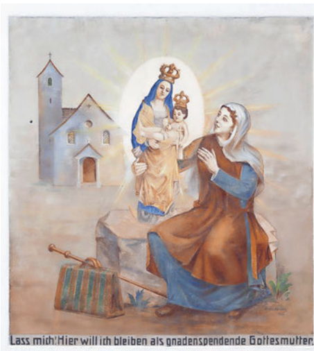
Aussenwand der Alten Kapelle Seewen, 1939 von Maler André Schindler geschaffen.

Letztes Jahr trafen sie sich bei Gesellschaftsspielen in Schwyz. Dieses Jahr sind alle Frauen von Schwyz, Ibach und Seewen zu einer gemeinsamen Maiandacht in Seewen eingeladen.