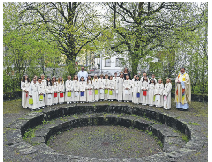
Erstkommunionkinder in Ibach